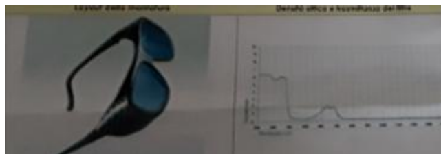
Figure 1 Gli occhiali di protezione devono essere venduti con un documento tecnico che fornisce il coefficiente di assorbimento delle lenti in funzione della lunghezza d'onda della radiazione incidente, spesso questo dato viene fornito sotto forma di grafico